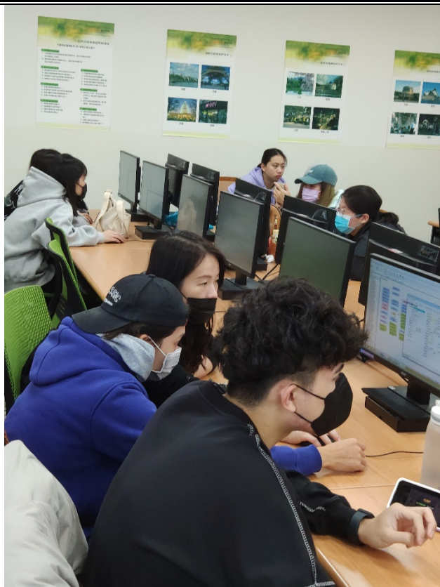
業師示範操作步驟