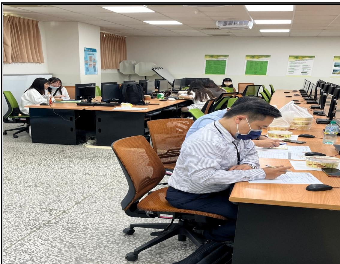
業師及學生在會場準備