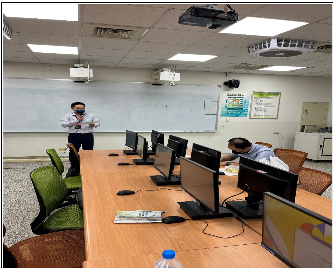
業師諮詢輔導說明