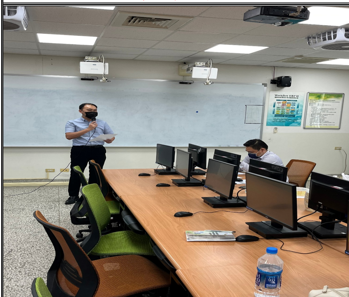
業師諮詢輔導說明