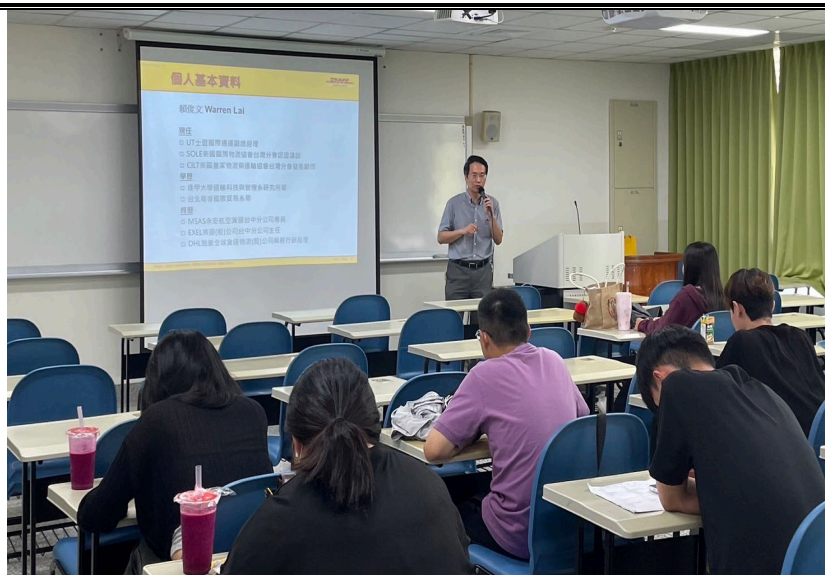
5/2 日 上課照片(4)