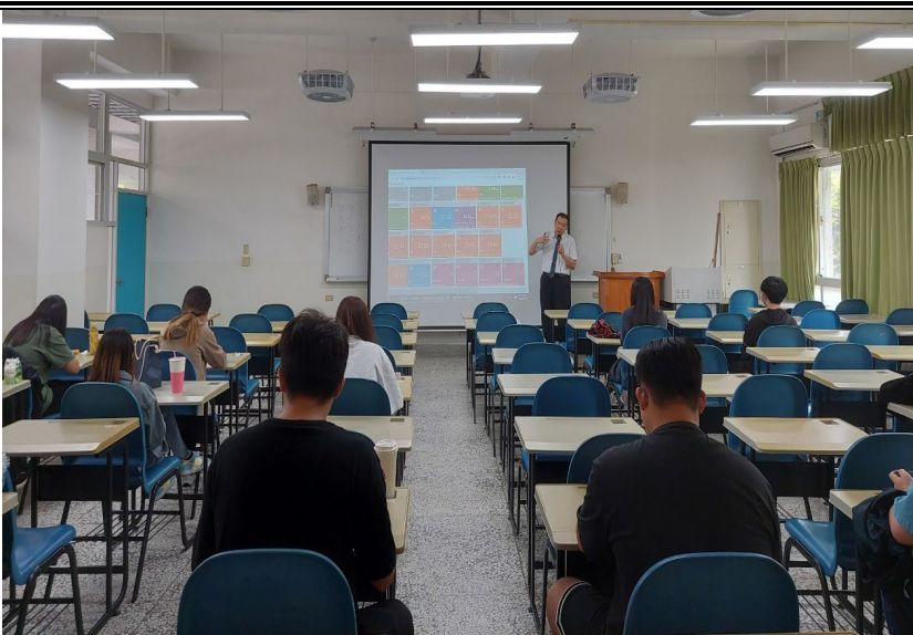
5/8 日 上課照片(6)