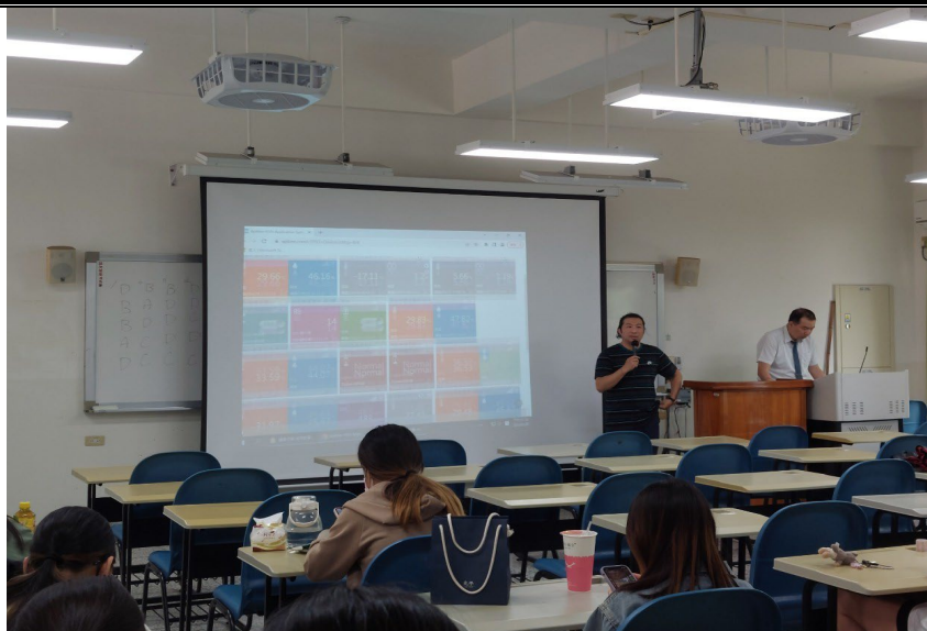
4/29 日 上課照片(1)