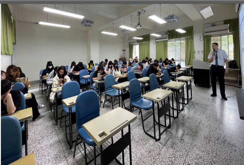
5/1 日 上課照片(3)