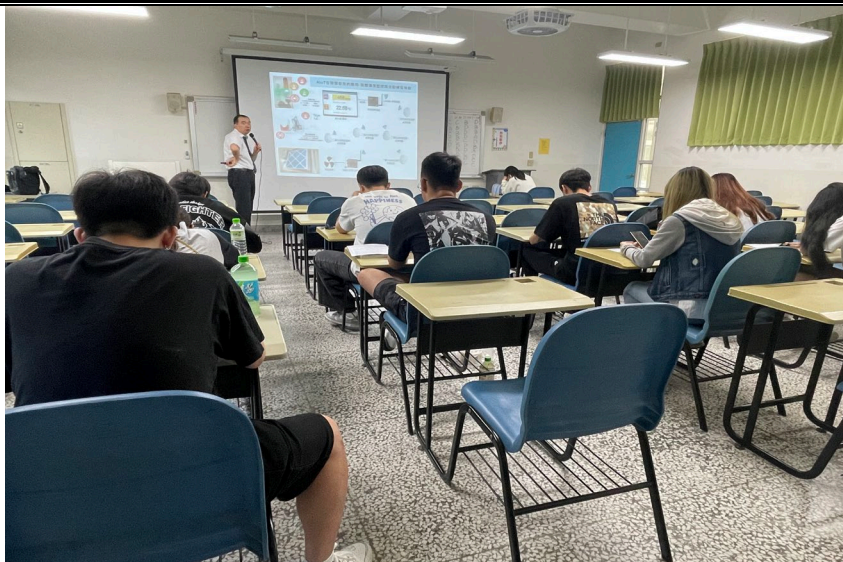
4/30 日 上課照片(2)